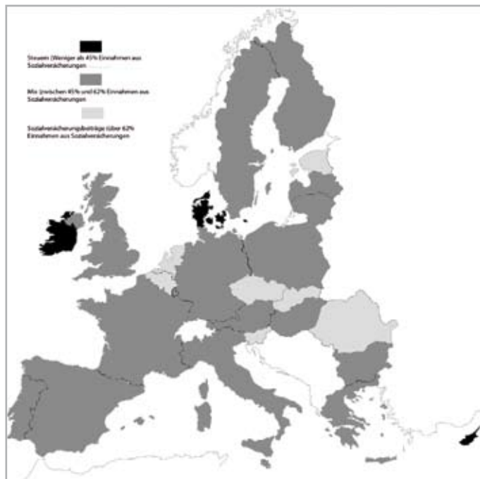
Abbildung 2: Gruppierung nach Finanzierungsform

Quelle: Bazant/Schubert 2009: 526; Luxemburg und Malta sind aus Gründen der besseren Erkennbarkeit nicht maßstabsgetreu dargestellt.