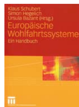
Das Handbuch zum Thema

Obwohl Esping-Andersens Typologie der vergleichenden Wohlfahrtsstaatsforschung bis heute als Bezugspunkt dient, ist sie doch vielfach kritisiert worden. Ein Kritikpunkt bezieht sich auf die Anzahl der identifizierten Wohlfahrtsstaatstypen: So sehen einige WissenschaftlerInnen die Antipoden