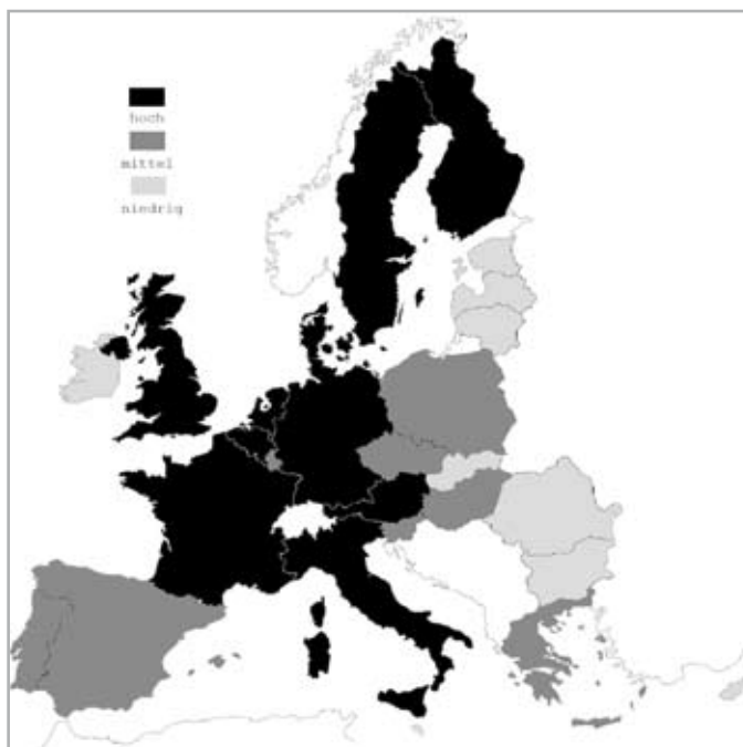
Abbildung 1: Gruppierung nach Sozialleistungsquote

Vor diesem Hintergrund ist an Abbildung 2 (siehe nächste Seite) vor allem eines auffällig, nämlich die große Zahl an Wohlfahrtssystemen mit einer Mischfinanzierung aus Steuern und Versicherungsbeiträgen. „Hier sind allem Anschein nach die Grenzen zwischen vormals klaren und gradlinigen Konzepten verwischt und uneindeutiger geworden“ (Blum et al. 2010: 5). Dies wird einerseits an den traditionellen Sozialversicherungs-