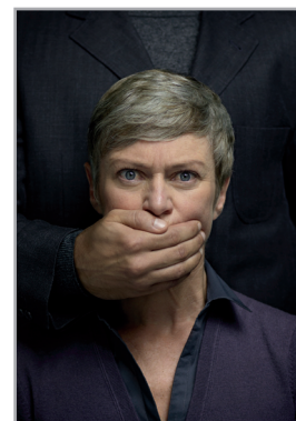
Wer das Schweigen bricht, bricht die Macht der Täter.

www.kija.at www.die-moewe.at/index.php?id=kinderschutzzentren Informationen vom BMWFJ zum Kinderschutz in Österreich: www.bmwfj.gv.at/Familie/Gewalt/Documents/KSO-Hilfseinrichtungen.pdf www.familienberatung.gv.at/ www.kinderrechte.gv.at/home/service/kinderschutzeinrichtungen/content.html