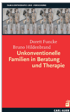
Funcke/Hildenbrand 2009: Unkonventionelle Familien in Beratung & Therapie

Die Diskussionen darüber, was Familie ist, was sie leisten soll und inwieweit das Kernfamilien-Ideal heute überhaupt noch trägt, sind meist immer ideologisch geprägt und bleiben oft in der Grundsatzfrage stecken, ob man sich nun wertkonservativ oder sozial-liberal positioniert. Anders ausgedrückt: Immer scheint sich alles um die persönliche, politische oder wissenschaftliche Einschätzung zu drehen, ob allein die Kernfamilie als Ideal gelten darf – oder eben nicht.