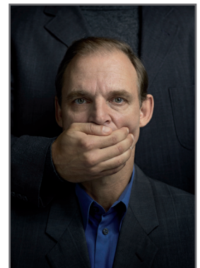
Ein Bildmotiv der Aufklärungskampagne „Sprechen hilft“: www.sprechen-hilft.de

Die zahlreichen Aufdeckungen sexueller Misshandlungen vor allem in kirchlichen und (reform)pädagogischen Einrichtungen haben Anfang des Jahres 2010 ein erstaunliches Echo in der bundesdeutschen Medienlandschaft ausgelöst. Frühere Versuche, institutionalisierte sexuelle Gewalt öffentlich zu machen, fanden in den Medien hingegen keine nennenswerte Resonanz (etwa