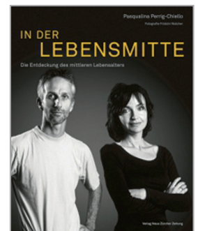
Perrig-Chiello, Pasqualina (2011, 5. Aufl.): In der Lebensmitte. Die Entdeckung des mittleren Lebensalters. Zürich: NZZ Libro.

Aus entwicklungspsychologischer Perspektive ist für das mittlere Lebensalter kennzeichnend, dass für einen Großteil der Frauen und Männer zentrale lebenszyklische Ablösungsprozesse stattfinden. Neben der Auseinandersetzung mit der Fragilisierung und dem Tod der Eltern, sind das Erwachsenwerden und der Auszug der Kinder aus dem Elternhaus von zentraler Bedeutung. Hinzu kommt, dass sich die Menschen im mittleren Alter auch sonst mit vielen anderen Herausforderungen konfrontiert sehen, die für diese Lebensphase typisch oder zumindest häufig sind, wie etwa die Wechseljahre, die langjährige Partnerschaft, berufliche Motivationsprobleme etc. Die Tatsache, dass für viele Betroffene diese Phase intensiv und stressreich ist, spiegelt sich in der Lebenszufriedenheit wider, welche im Altersgruppenvergleich nie so tief ist wie in den mittleren Jahren (Blanchflower/